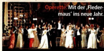
Operette. Mit der 'Fledermaus' ins neue Jahr.

Kultdisco: Im U4 feiern Sie unter dem Motto „Addicted Floor“ zu Klängen von Metallica, Green Day, Die Ärzte u. v. m. bis ins neue Jahr. Ab 22.00 Uhr. Abendkassa: 10 Euro. Infos: www.u-4.at