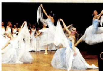
Le Grand Bal. Gigantischer Auftakt in die Ballsaison in der Wiener Hofburg.

Silvesterpfad: Viele Gastronomen servieren Punsch und kulinarische Spezialitäten in der Wiener Altstadt, von der Innenstadt bis zum Prater. Die Wiener Tanzschulen bieten am Stephansplatz schnelle Walzertanzkurse, der Prater lockt mit einem großen Feuerwerk. Außerdem: großes Angebot an Showprogramm.